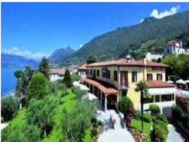
Ristorante Villa Kinzica