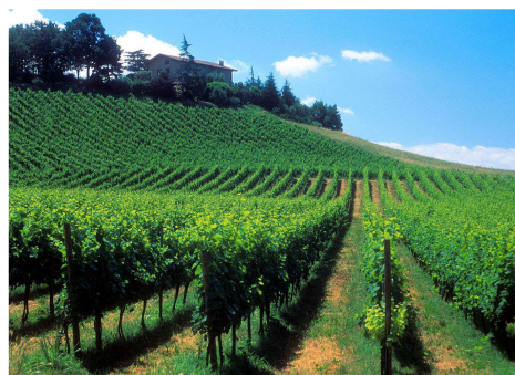
I Vitigni di Franciacorta