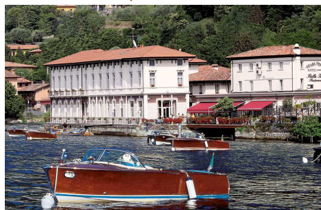
Hotel Araba Fenice Pizzone d'Iseo